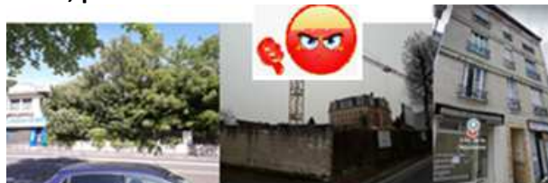
Ex- Pharmacie Fontaine Maison Dunoyer 5 Résistance

Nos villes chauffent, il faut les renaturer* et arrêter de les densifier et les dénaturer.