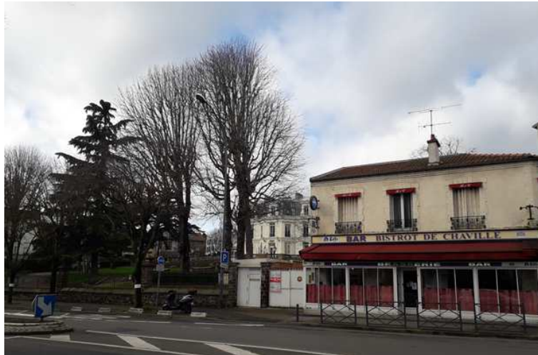
Le Bistrot de Chaville, vue de l'avenue Salengro

Cette simple photo statique ne saurait exprimer le caractère convivial de ce bistrot tant apprécié des chavillois. Par contre, cet immeuble bas n'oblitére en rien la perspective vers la Mairie. Sans être d'une architecture remarquable, il est cependant typique de l'architecture de banlieue et en est un témoin bientôt solitaire.