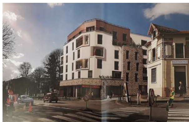
Perspective du dossier de permis