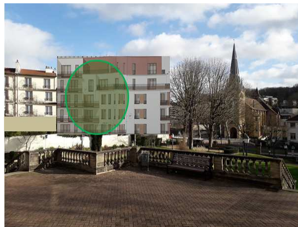
Montage numérique avec bâtiment prévu