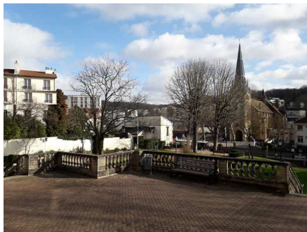
Vue actuelle en date du 4/02/2020

Aussi est-il nécessaire de faire le montage photographique suivant :