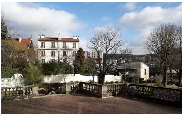
Le Bistrot avec son jardin arboré, vue de la Mairie

Cette simple photo statique ne saurait exprimer le caractère convivial de ce bistrot tant apprécié des chavillois. Par contre, cet immeuble bas n'oblitére en rien la perspective vers la Mairie. Sans être d'une architecture remarquable, il est cependant typique de l'architecture de banlieue et en est un témoin bientôt solitaire.