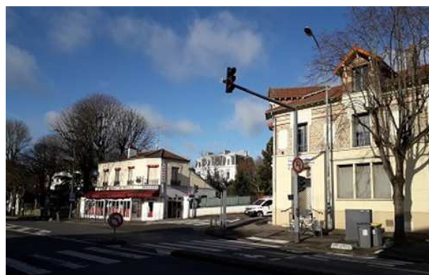
Vue actuelle en date du 12/02/2020

Le dossier du permis permet de répondre à cette question.