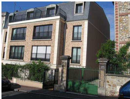
(Le 13 avec son revêtement de façade rappelant la meulière)

L'association et les riverains ont aussi œuvré fortement pour que l'immeuble s'intègre harmonieusement dans le boulevard ce qui n'était pas prévu à l'origine du second projet.