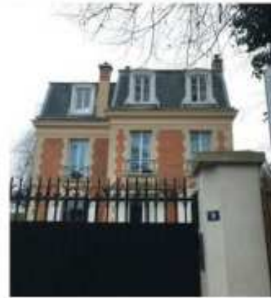
Agit pour Chaville